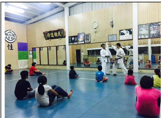
邀請空手道師資指導弱勢家庭兒童提升自我防衛能力。