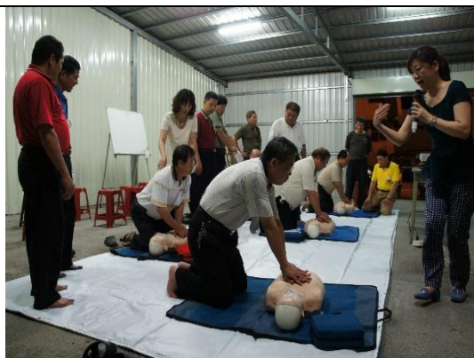
邀請醫院護理師訓練守望相助隊員急救能力