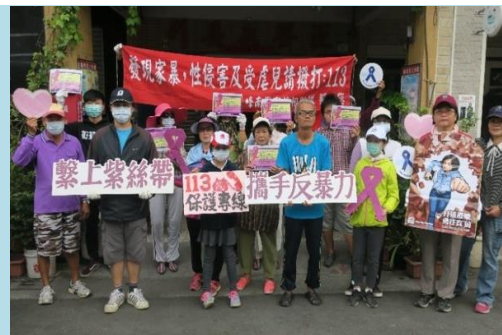
▲反家暴等宣導活動