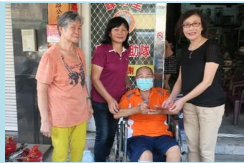
▲急難家庭關懷慰問