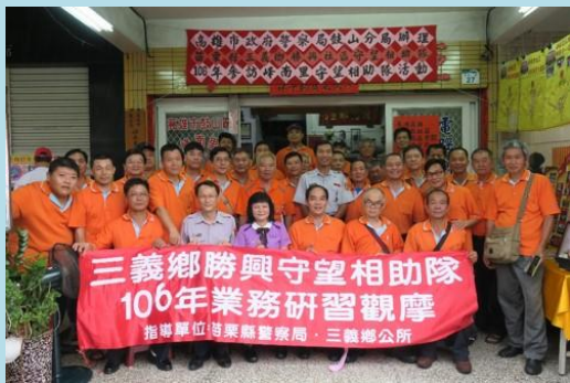
▲苗栗三義鄉勝興守望相助隊 蒞臨研習觀摩交流