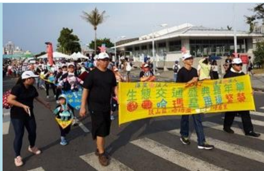
▲參加生態交通推動綠能遊行活動