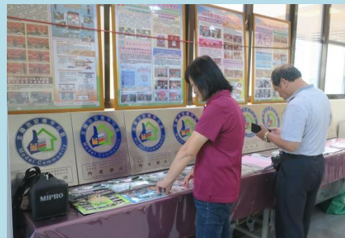
▲參加高雄市社區治安研習觀摩活動