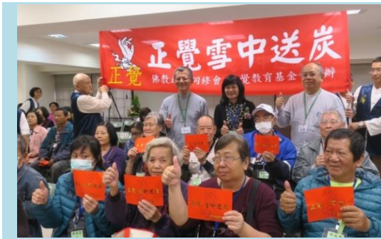
▲急難家庭關懷慰問