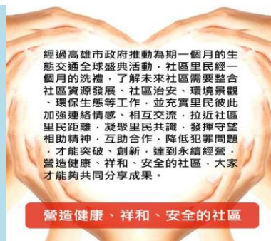
▲營造健康、祥和、安全的社區