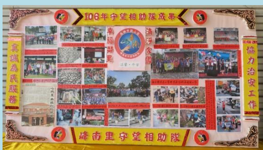
▲峰南里守望相助隊推動治安活動成果