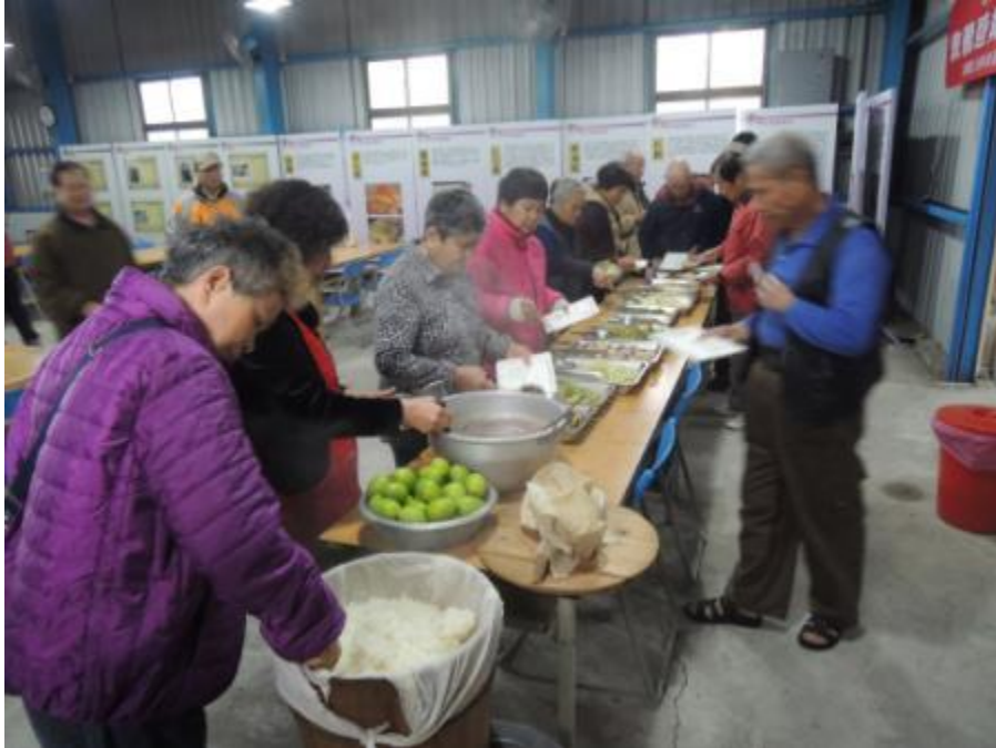
圖五：高齡志工服務

本社區與石油事業退休人員協會，共同組織嘉油祥和志工隊，跨單位合作，服務高齡長者，並於 107 年 10 月份榮獲衛生福利部單項特色獎。