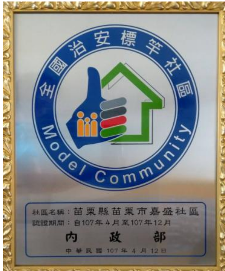
圖三：嘉盛社區連續九年獲內政部治安標竿社區

本社區在治安上的工作，也是相當用心，曾榮獲衛福部紫絲帶反家暴創意活動全國冠軍。也連續榮獲內政部治安標竿社區，至今第九年。