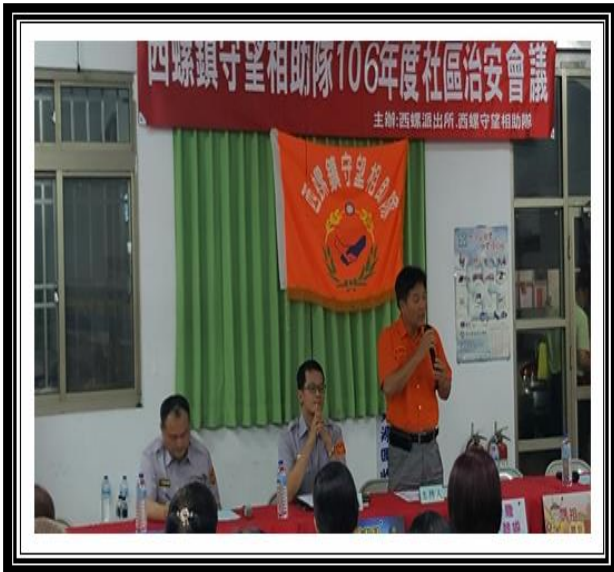
定期舉辦治安講座