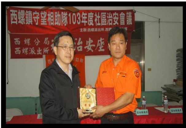
治安社區評鑑為優等