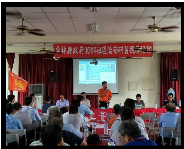
社區治安研習觀摩活動