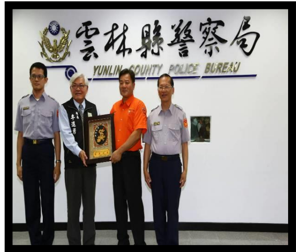
治安社區評鑑為優等