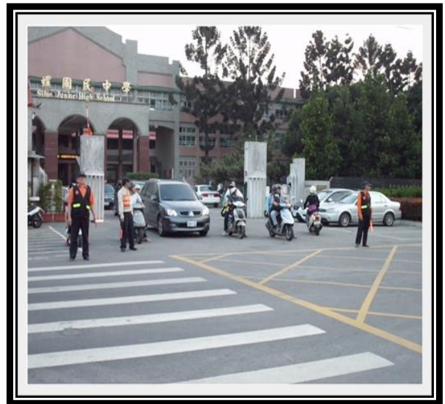
加強校園安全巡邏