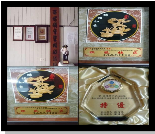
治安社區評鑑為優等