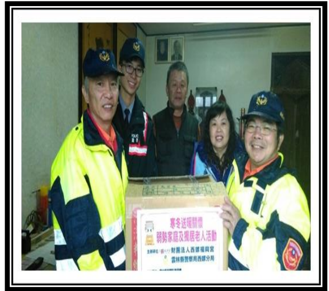
協助社區急難救助