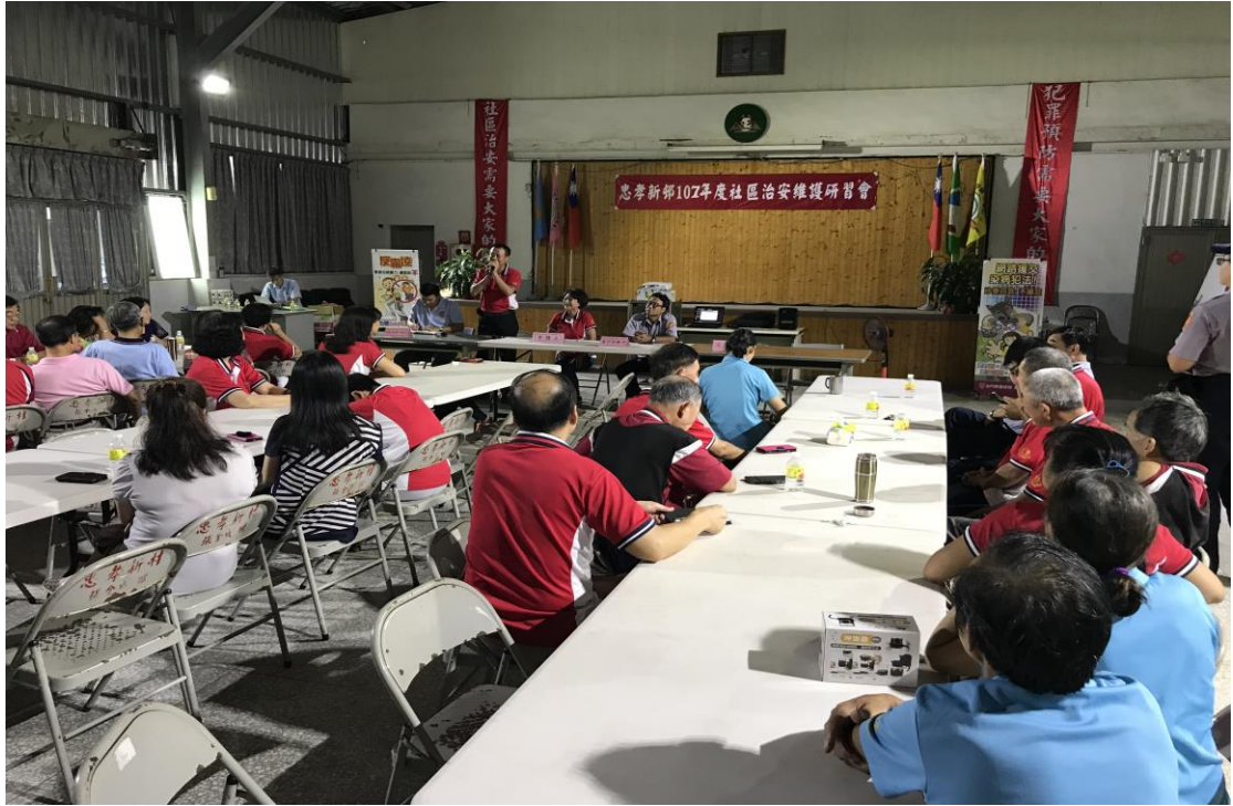
忠孝新村社區於 107 年下半年辦理社區治安研習情形