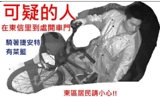
針對犯罪情事由里民提供犯罪影像並由里辦公處協助製作治安快訊發布提醒里民注意