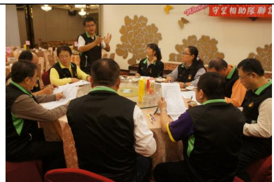
守望相助隊會議討論夜間巡邏較易出現異常及發生交通事故地點。並繪製治安地圖公布提醒民眾注意小心