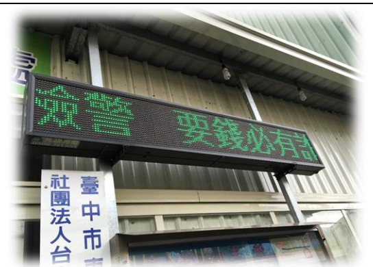
守望相助崗哨及里辦公處跑馬燈隨時宣導治安事件