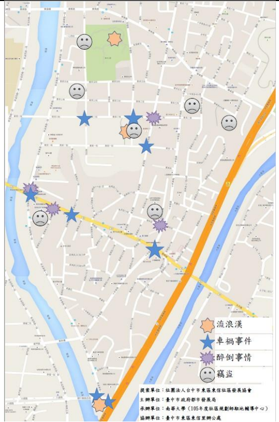
針對社區易生治安、交通事故場所或路段進行調查，並編纂社區治安地圖供民眾週知，每年開會檢討治安熱點是否更易，並進行資料更新。