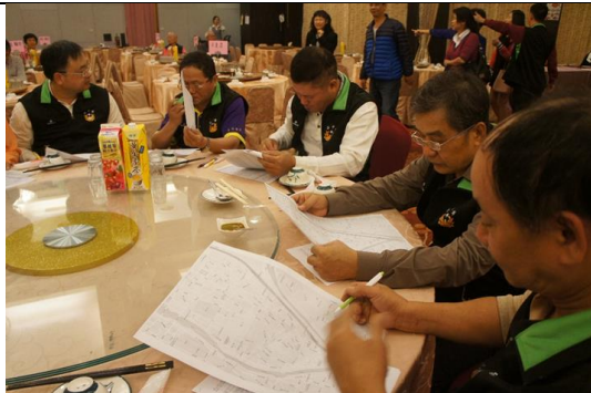
社區守望相助隊員針對值勤時發現治安狀況點進行標註，並與三分局與東區分駐所分享相關資料，進行社區治安地圖資料更新