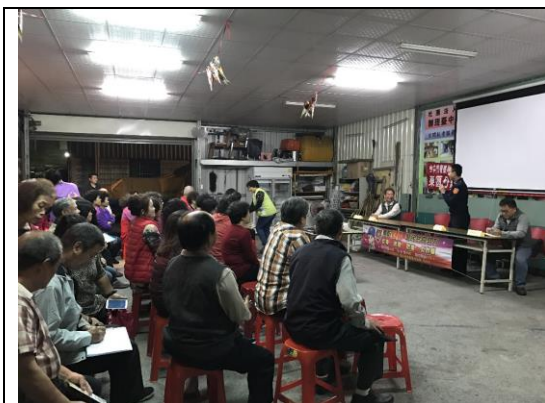
治安會議邀集社區里民、鄰長討論治安議題，並由分駐所員警針對建議進行回饋與評估