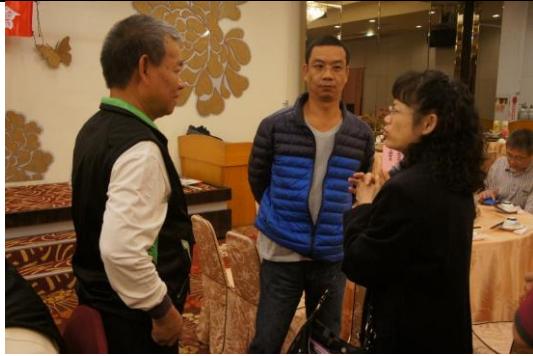
里長及守望相助隊幹部與轄區成功國小校長、家長會長討論學童上學交通及治安安全問題